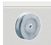
Doppel-Spurkranzrad aus Stahl BS 970 Lauffläche sauber überdreht