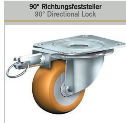
90° Richtungsfeststeller 90° Directional Lock