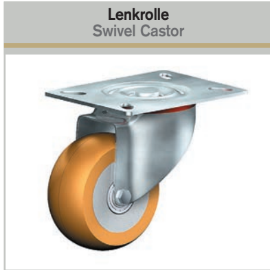
Lenkrolle Swivel Castor