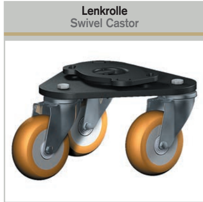
Lenkrolle Swivel Castor